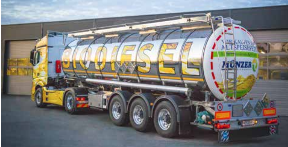
B10 als sofort wirksamer Hebel für den Klimaschutz

(B7) verhindert die volle Nutzung heimischer Kapazitäten und mindert die mögliche Emissionsreduktion. Nachhaltiger, abfallbasierter Biodiesel ist sofort verfügbar, reduziert Treibhausgase um bis zu 90 % und kann ohne Anpassungen in allen Dieselfahrzeugen eingesetzt werden. Eine Anhebung auf 10 % (B10) würde den