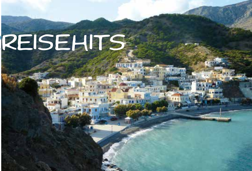
Ein wunderschönes Reiseziel ist Diafani – ein unvergesslich schöner Hafenort auf Karpathos.

Für Fans der Kanarischen Inseln gibt es Direktflüge nach Gran Canaria und Tene-