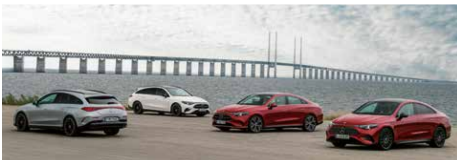
Umfassende Informationen und Inspirationen erhalten Sie in Ihrem Autohaus Peternel in Bad Radkersburg.

Mit dem CLA Shooting Brake führt Mercedes-Benz die sportlichen Proportionen eines viertürigen Coupés mit mehr Laderaum und einer großen Heckklappe in das elektrische Zeitalter.